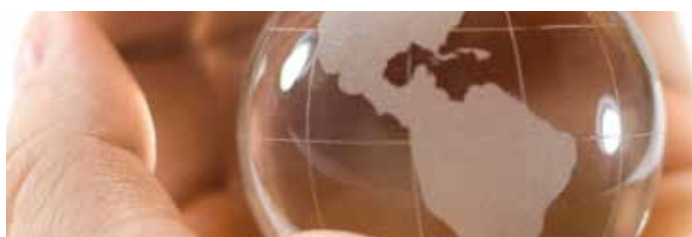
12 Marchés de Colombie et du Mexique sont les nouveaux enjeux du Groupe Lena