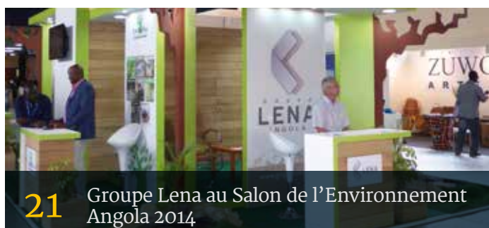
21 Groupe Lena au Salon de l'Environnement Angola 2014

03 Editorial · Nous sommes qui nous semblons être