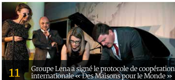
11 Groupe Lena a signé le protocole de coopération internationale « Des Maisons pour le Monde »