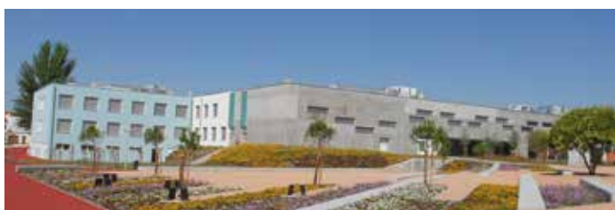
18 Lycée de Campo Maior inauguré